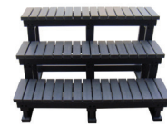
ESCALIER - Réf : 7230

RETROUVEZ L'ENSEMBLE DE NOS ACCESSOIRES SUR WWW.BE-SPA.FR