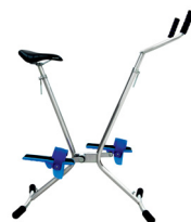
VÉLO AQUAFITNESS - Réf : 30213