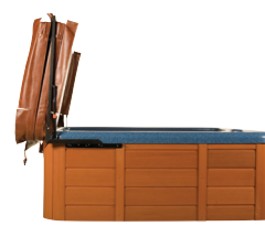
LÈVE-COUVREURE - Réf : 3049